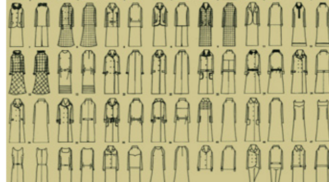
Vorder- und Rückansichten von Modellen in SIBYLLE 6/1968

Einen Einblick in die Rezeption der Zeitschrift und in den DDR-Alltag geben Interviews mit SIBYLLE-Leserinnen und eine Auswahl von Leserbriefen. Auch Frauenporträts, die in der SIBYLLE erschienen, sowie Ausschnitte von Sendungen des DDR-Fernsehens, statistische Daten und Hintergrundinformationen verdeutlichen das Frauenbild und die Frauenrealität in der DDR.