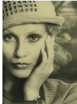
Sommerhüte in SIBYLLE 3/1978 mit einem Foto von Ute Mahler

Eine Ausstellung des Hauses der Brandenburgisch-Preußischen Geschichte im Rahmen des Themenjahres von Kulturland Brandenburg 2010 „Mut & Anmut. Frauen in Brandenburg-Preußen“