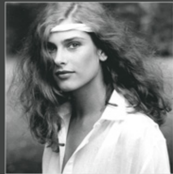
Sibylle Modefotografien 1962–1994 Lehmstedt

Besucher der Filmmatinee haben bei Vorlage der Eintrittskarte ermäßigten Eintritt in die Ausstellung SIBYLLE. Modefotografie und Frauenbilder in der DDR .