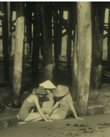
Aus der Serie „Seebäderbilder“ in SIBYLLE 2/1981

Die Zeitschrift SIBYLLE gehörte in der DDR wegen ihrer einzigartigen Mode- und Fotobeiträge zu den beliebtesten Publikationen.