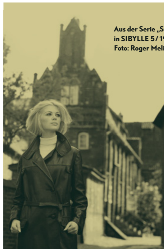
Aus der Serie „Stralsund“ in SIBYLLE 5/1967 Foto: Roger Melis, 1967

Die Ausstellung präsentiert ausgewählte Fotoserien und kombiniert sie mit Aussagen von Redakteurinnen, Mannequins und Fotografen über die Arbeitsweise und -bedingungen bei der Moderedaktion der SIBYLLE. Bekleidungsstücke des Modeinstituts der DDR und des VHB Exquisit sowie Filmsequenzen von Modeseudungen der DDR zeigen Träume von damals. Ein Exkurs über die Bildsprache und ästhetischen Besonderheiten der Fotografien ergänzen das Thema Mode als Hauptarbeitsfeld der SIBYLLE.